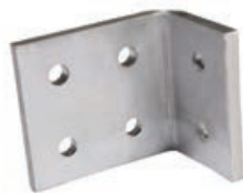
90° BÜKÜMLÜ ALÜM. LAMA