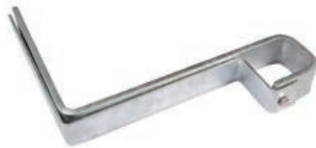
BORU TAŞIYICI ASKI TAKIMI